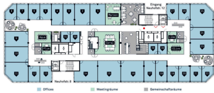
Übersichtsplan - 31 Offices / 6 Meetingräume / ästhetische Gemeinschaftsräume