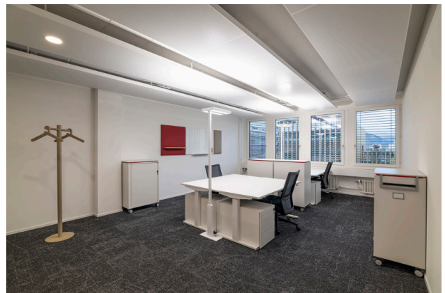
Ihr neues Teamoffice mit Kapazität bis zu 6 Arbeitsplätze (33.3 m 2 )