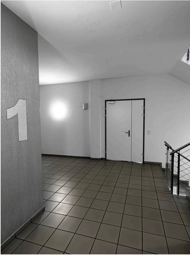
Treppenhaus / Eingangsbereich