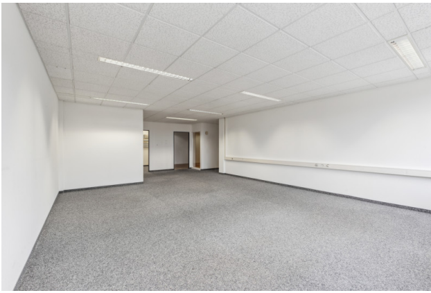
Büroraum Nr. 3