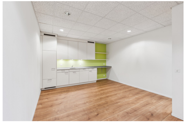
Küche / Aufenthaltsraum