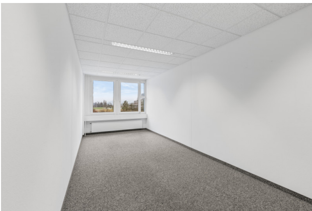
Büroraum Nr. 2