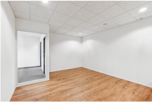
Küche / Aufenthaltsraum