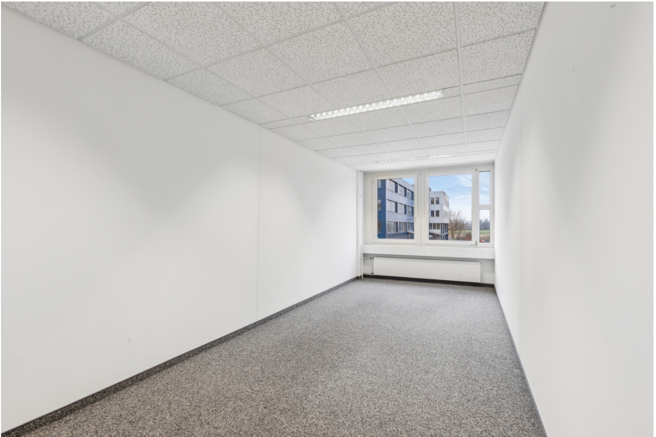
Büroraum Nr. 1