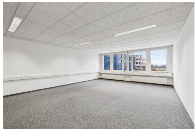
Büroraum Nr. 3