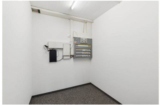
Archiv / Netzwerkraum