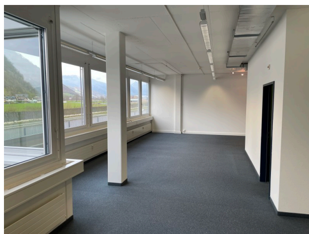
Grossraumbüro Bild 2