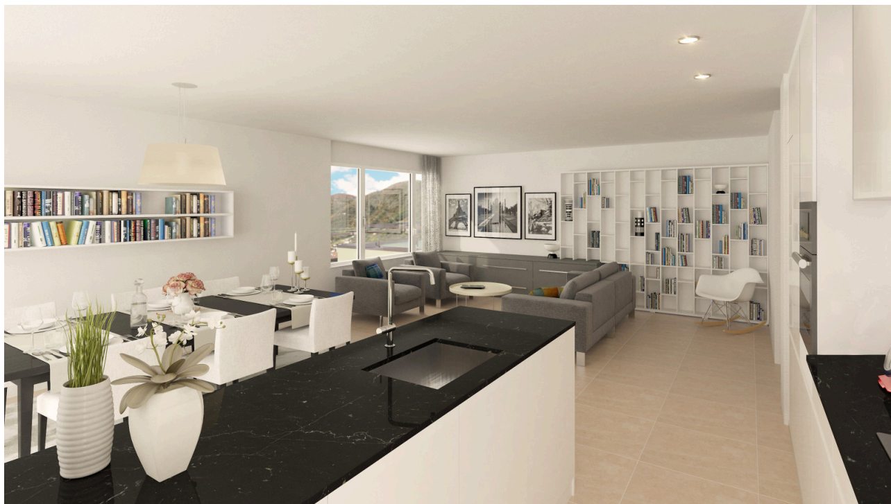
Foto indicativa a campione soggiorno cucina