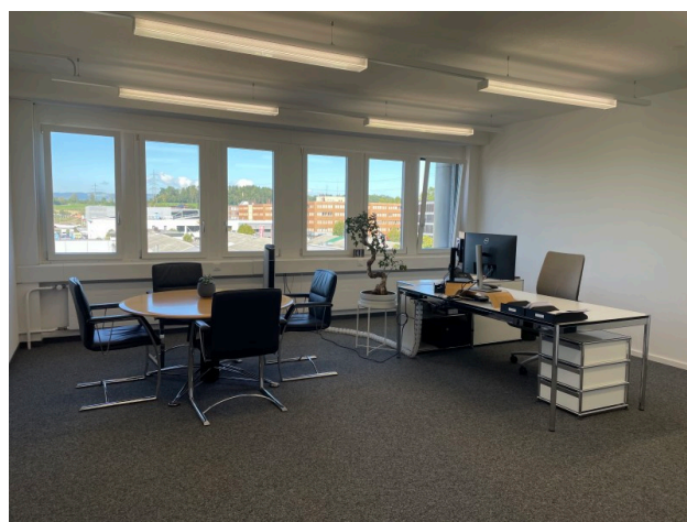
Einzelbüro Nr. 1