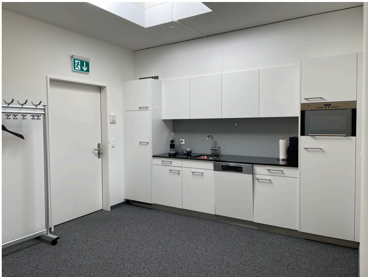
Entrée und Teeküche