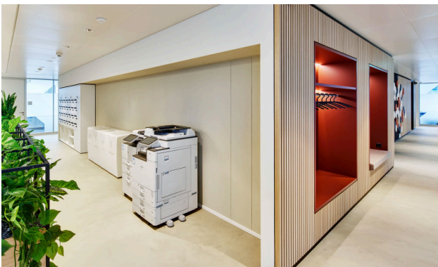
Der tägliche Postservice, die Druckgeräte (fair use) und wöchentliche Office-Reinigung sind im Preis inbegriffen.