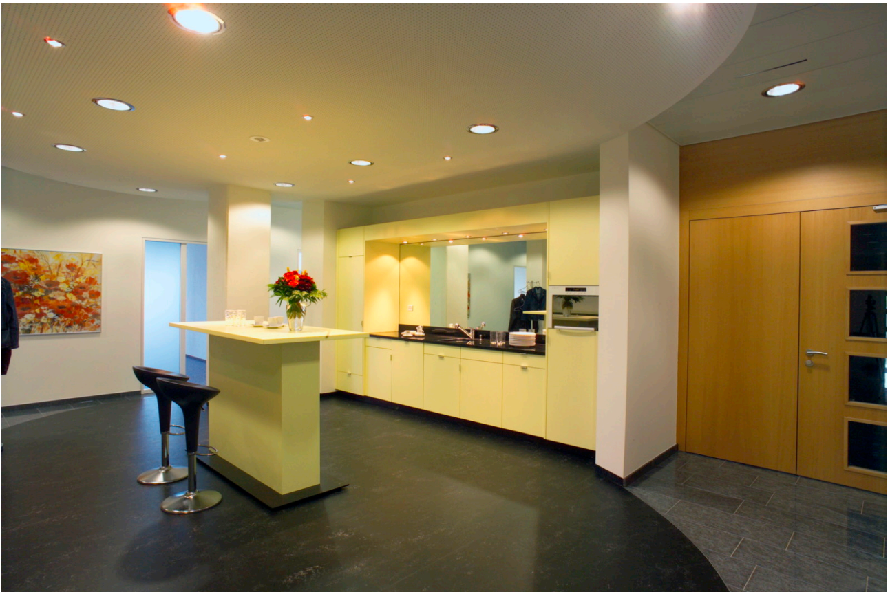
Entrée mit Teeküche/Aufenthalt