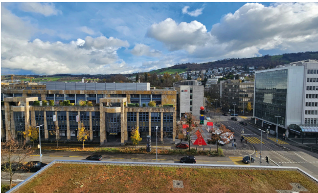
Aussicht vom Balkon