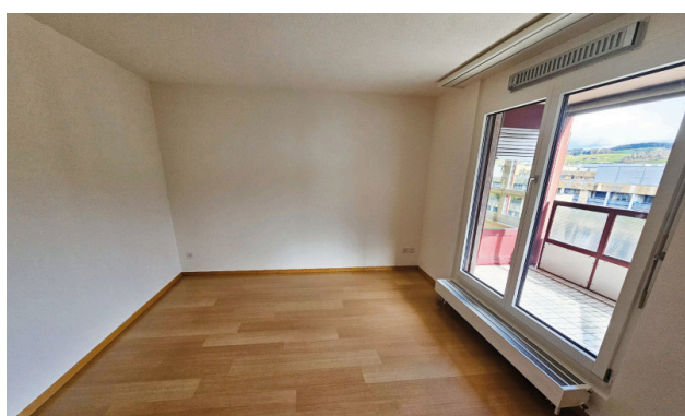
Schlafzimmer mit Balkon