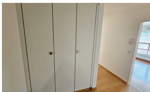
Einbauschränk beim Eingang