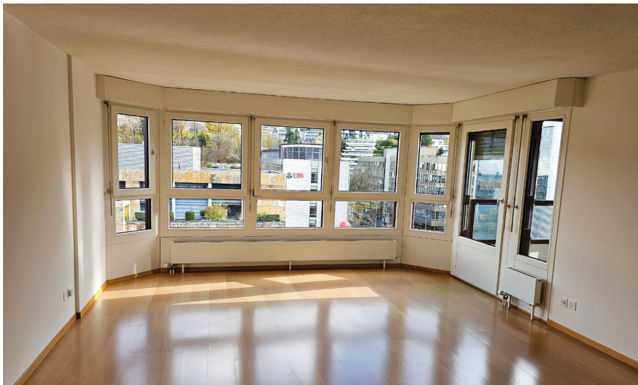
Wohnzimmer mit Balkon