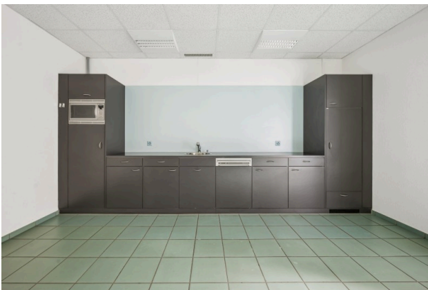
Küche / Cafeteria