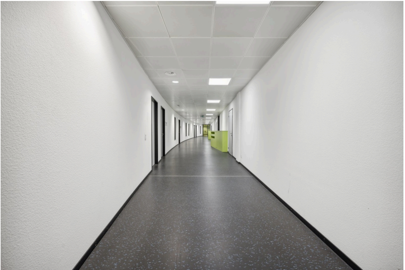
Erschliessungskorridor ab Treppenhaus