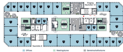
Übersichtsplan - 31 Offices / 6 Meetingräume / ästhetische Gemeinschaftsräume