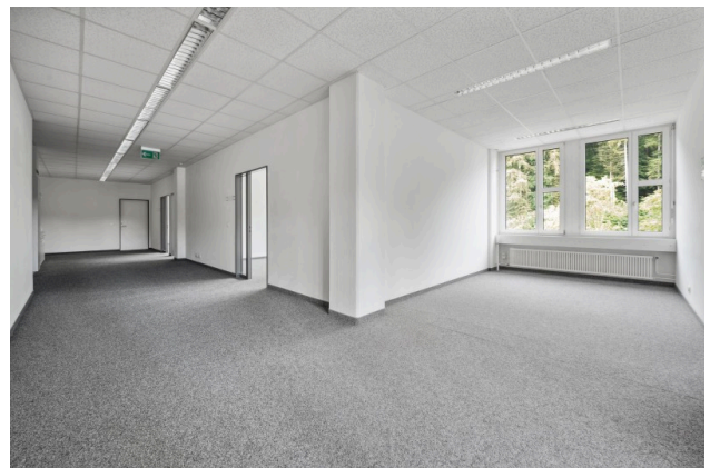
Korridor / offener Bürobereich