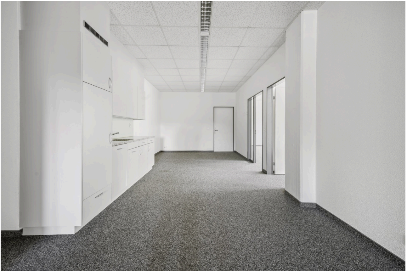
Küche / Aufenthalt