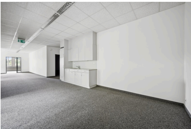
Küche / Aufenthalt