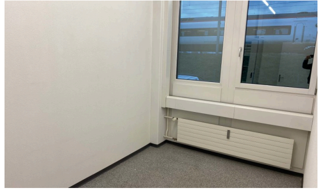
Server/Archiv mit Tageslicht