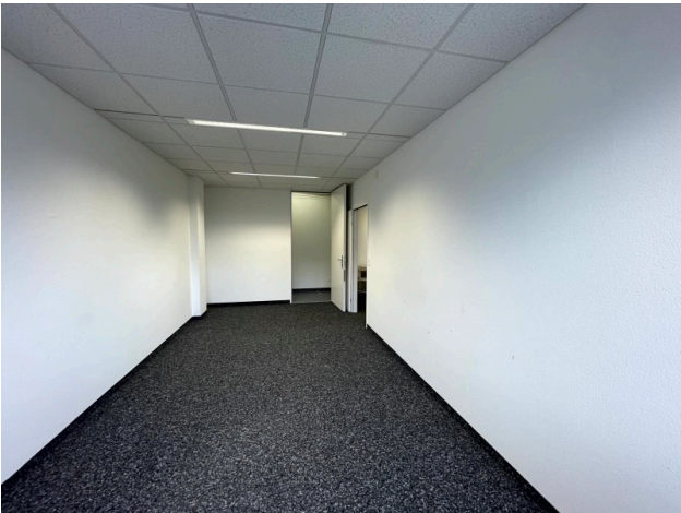
Büro mit Reduit