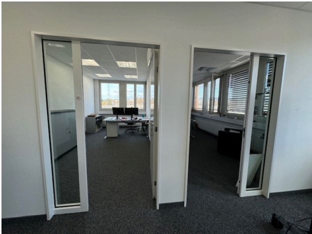
Büro Richtung Norden