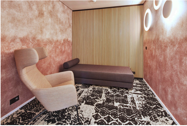
Recharge-Raum – Ihre kurze Auszeit für neue Energie