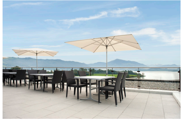
Dachterasse mit atemberaubender Sicht