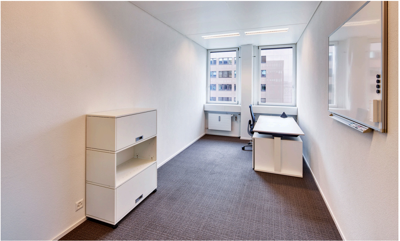
Ihr zukünftiges Einzeloffice (14.5 m 2 ) - per sofort bezugsbereit.