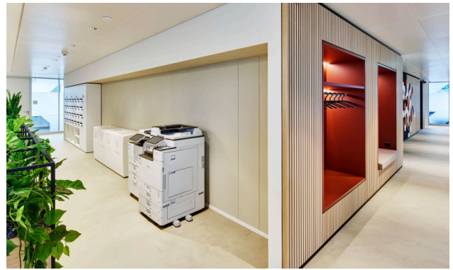
Der tägliche Postservice, die Druckgeräte (fair use) und wöchentliche Office-Reinigung sind im Preis inbegriffen.