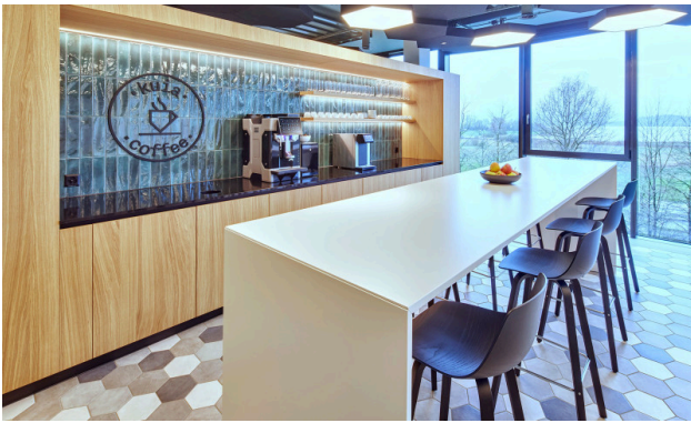
Der Coffee Corner ist der Treffpunkt im .kuia.office.