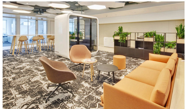
Die komfortablen Lounges laden zu einer kurzen Pause oder einem informellen Austausch ein.