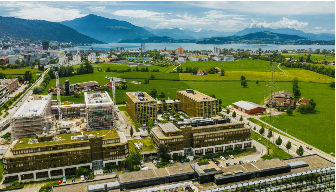
Blick von oben: Neuhof-Gebäude und die idyllische Natur rund um den Zugersee