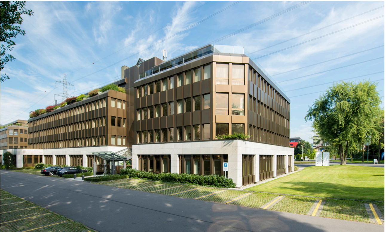
Südansicht des Geschäftshauses Neuhof – mit markanter, bronzener Metallfassade