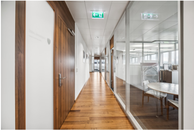
Bürofläche / Durchgang