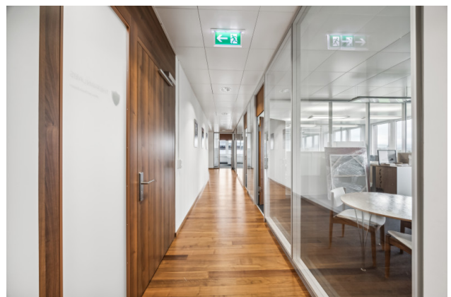
Bürofläche / Durchgang