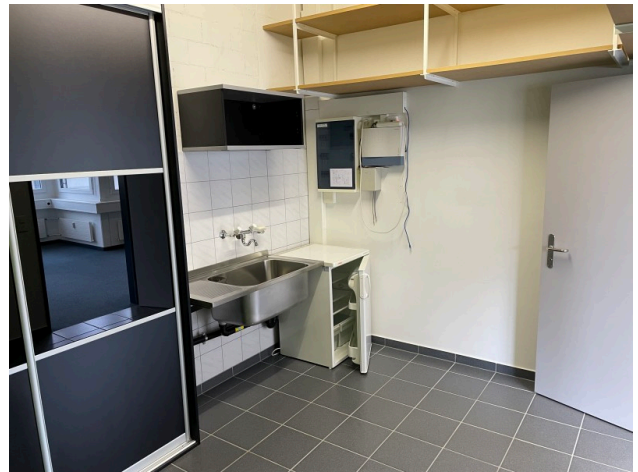
Archiv mit Lavabo Bild 2