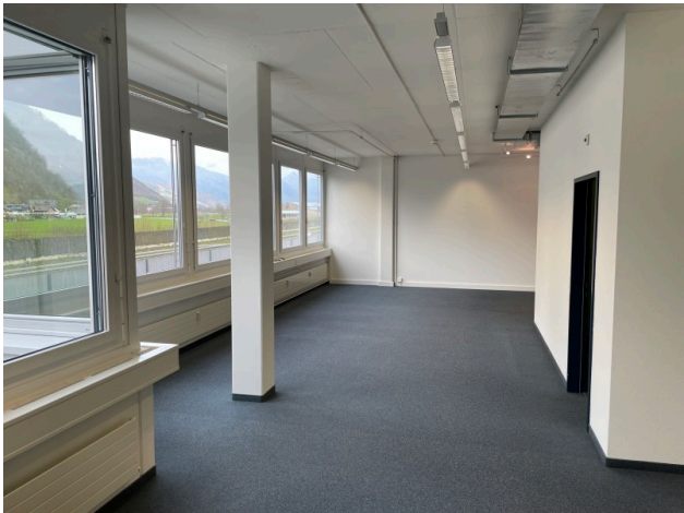
Grossraumbüro Bild 2