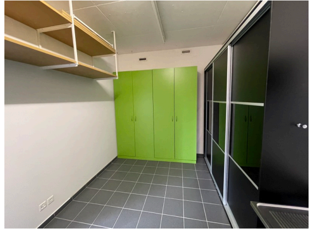
Archiv & Innenraum