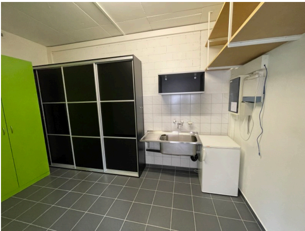
Archiv mit Lavabo