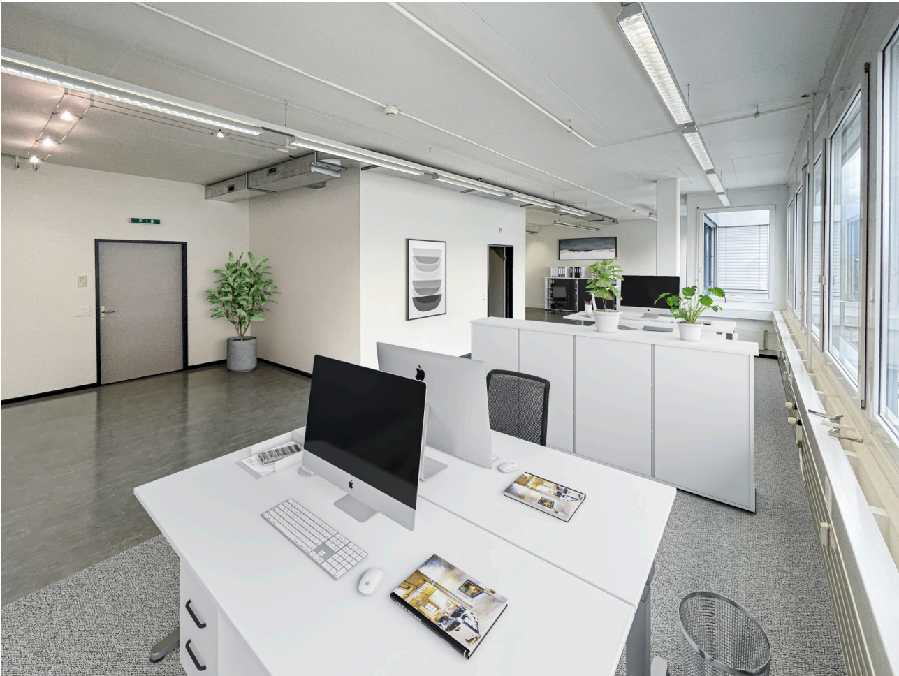
Grossraumbüro mit Einrichtungsvariante