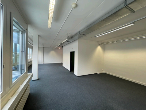
Grossraumbüro Bild 3