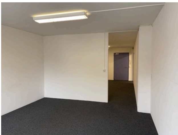
Durchgang zwischen Büroflächen