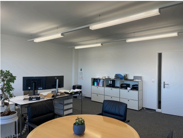
Einzelbüro Nr. 1