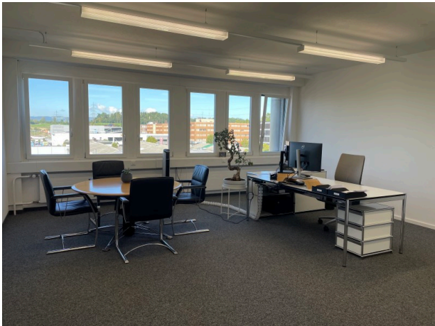
Einzelbüro Nr. 1