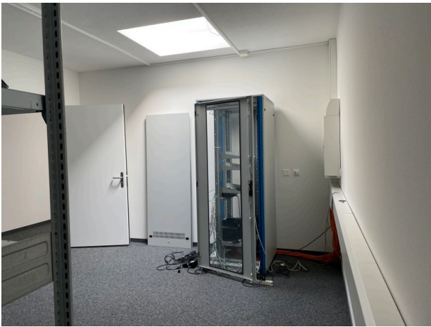
Archiv Nr. 4