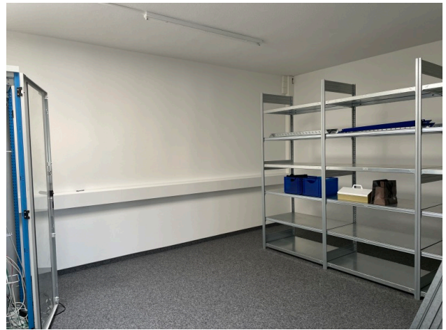
Archiv Nr. 4