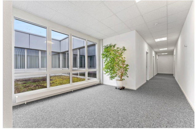
Korridor zu den Gemeinschaftsräumen