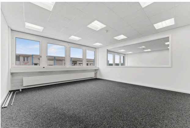
Bürofläche mit Glaseinsatz