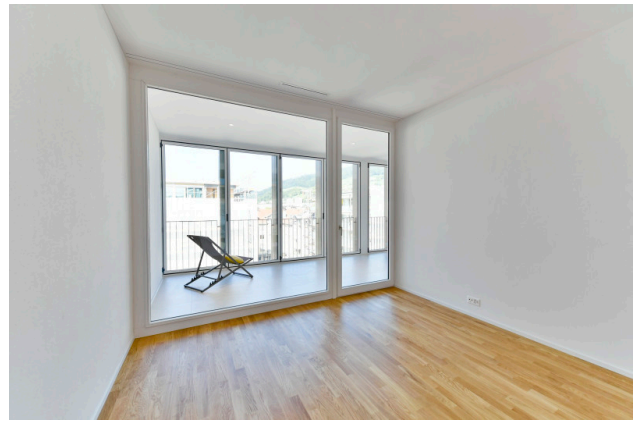
Schlafzimmer mit Loggia