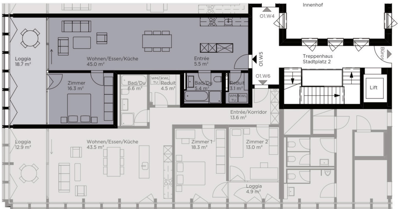
Grundriss Wohnungstyp W5