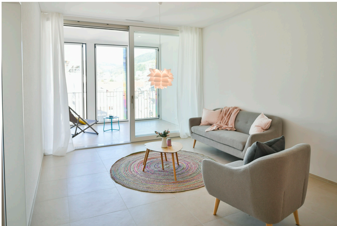
Wohnzimmer mit Loggia