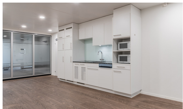
Teeküche und Aufenthaltsraum