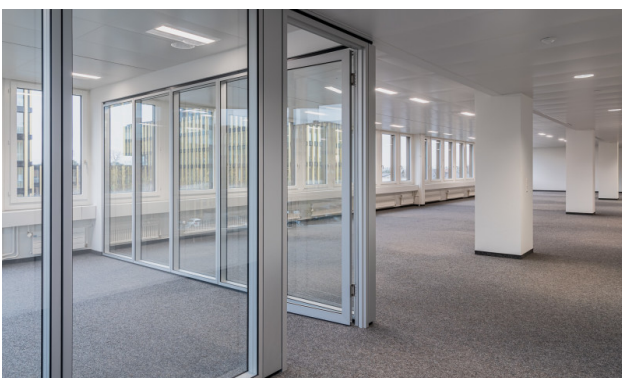
Eckbüro und Openspace-Bereich Südseite