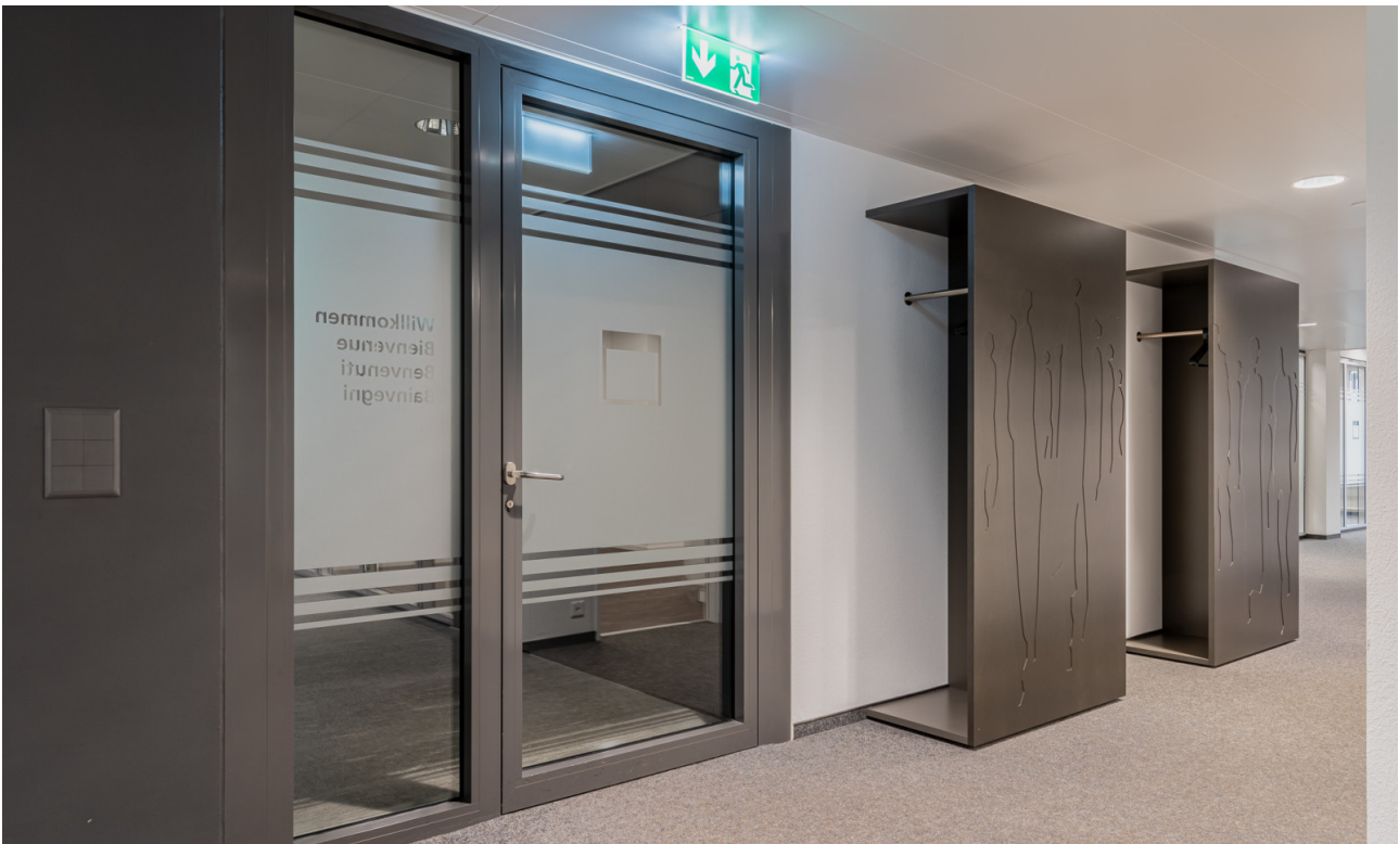
Eingang mit Garderobe