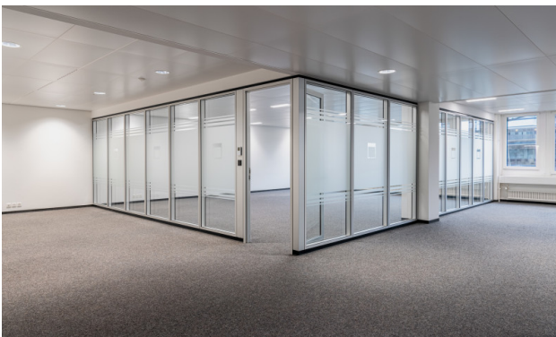
Sitzungszimmer oder Büro mit Glastrennwänden