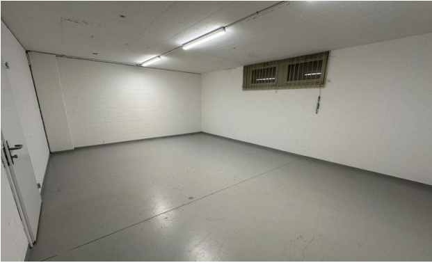
Archiv im Untergeschoss