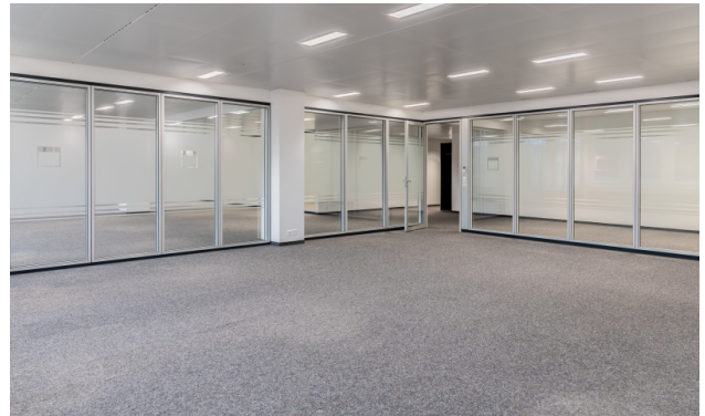
Sitzungszimmer oder Büro mit Glastrennwänden