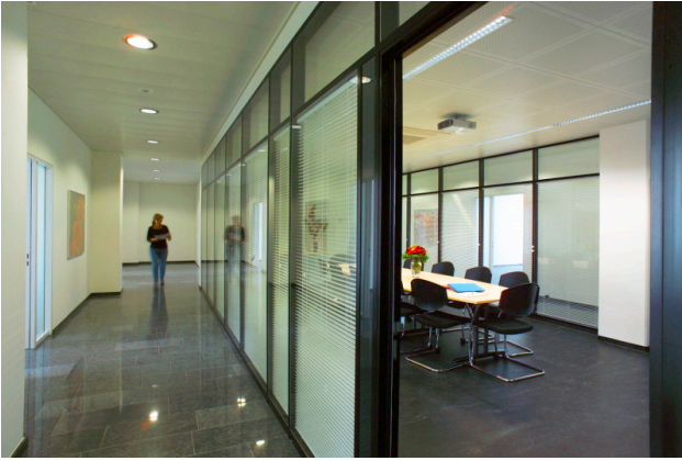
Korridor zu Büros/Sitzungszimmer