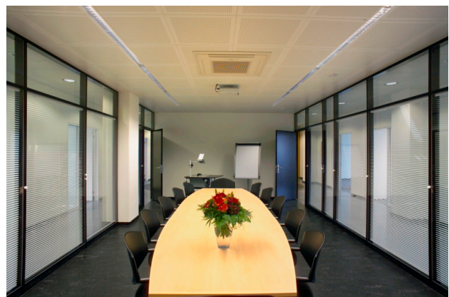
Sitzungszimmer, klimatisiert und möbliert