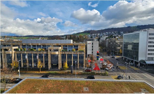
Aussicht vom Balkon