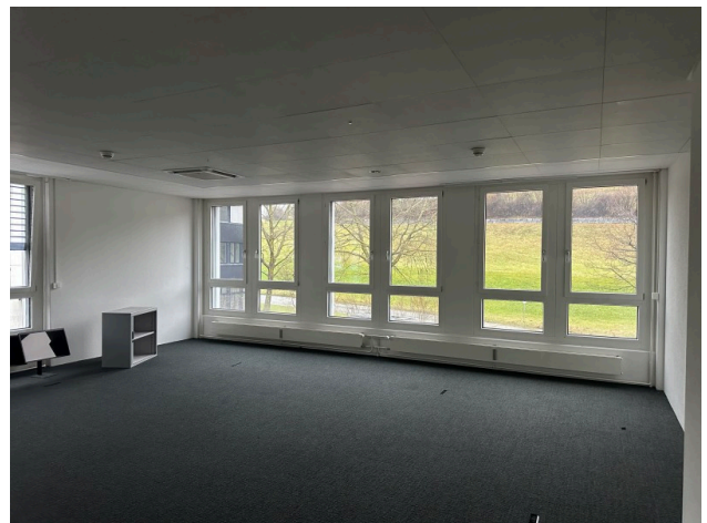
Innenansicht Einzelbüro Nr. 1