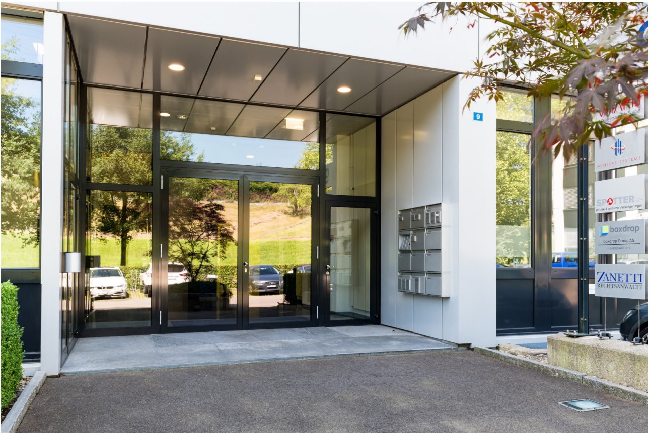
Haupteingang Blegistrasse 9