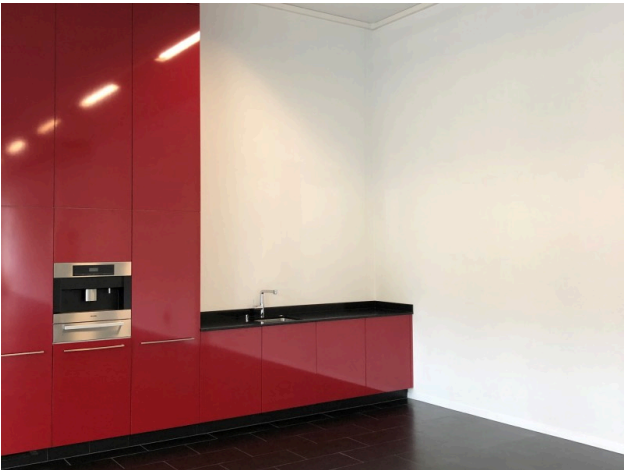
Küche in Ausstellungsfläche