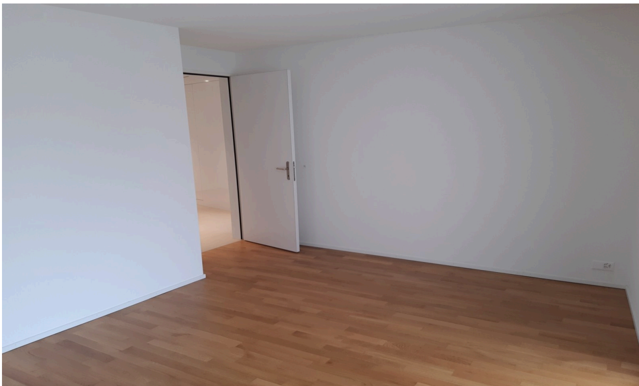
Chambre d'un autre appartement du bâtiment pour illustration