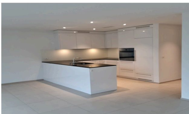
Cuisine d'un autre appartement du bâtiment pour illustration