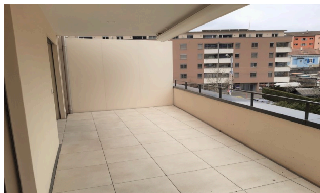
Terrasse d'un autre appartement du bâtiment pour illustration