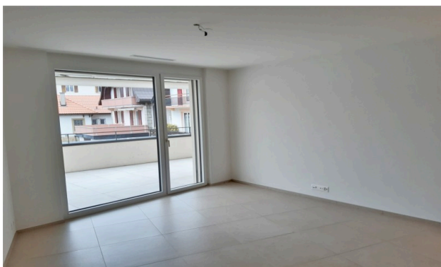
Séjour d'un autre appartement du bâtiment pour illustration