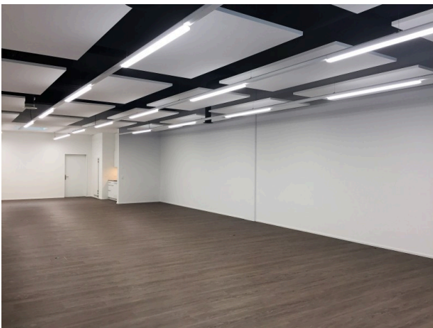
Sicht nach Innen, rückwärtig Teeküche