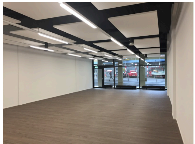
Sicht nach Aussen