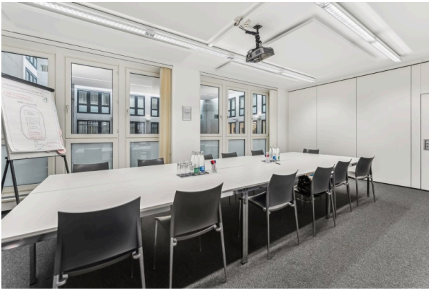
Innenansicht Idealbüro Beispielbild