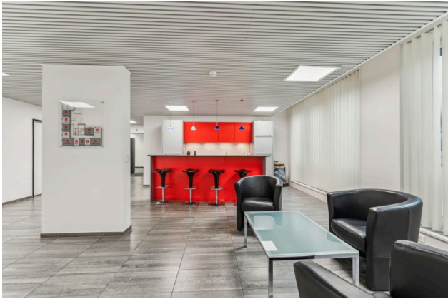
Cafébar zur gemeinsamen Benützung