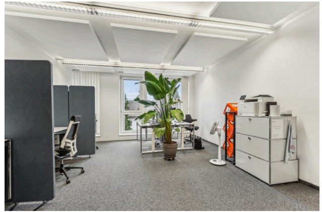
Innenansicht Idealbüro Beispielbild