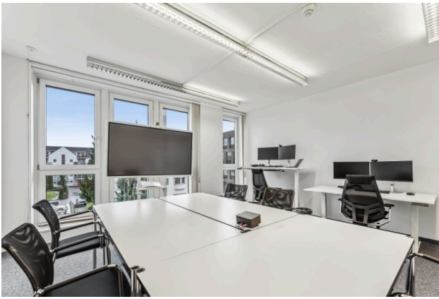
Innenansicht Idealbüro Beispielbild