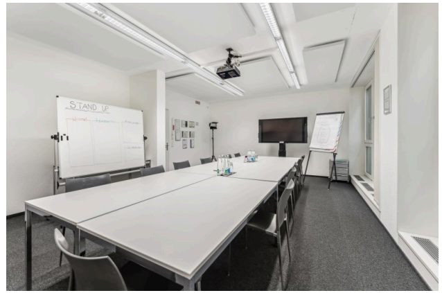
Innenansicht Idealbüro Beispielbild