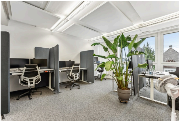
Innenansicht Idealbüro Beispielbild