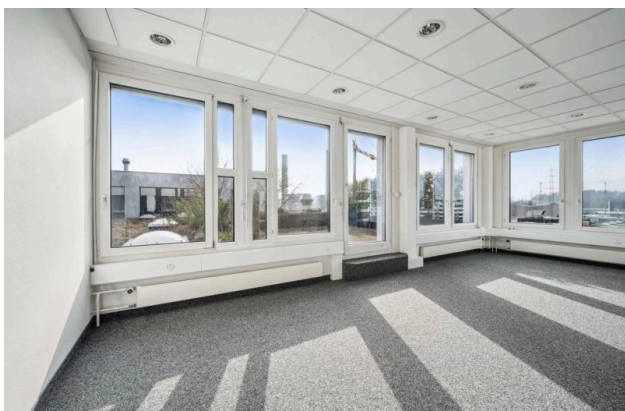
Empfangsbereich / Zugang Terrasse