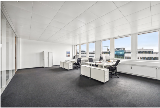
Grossraumbüro Nr. 4