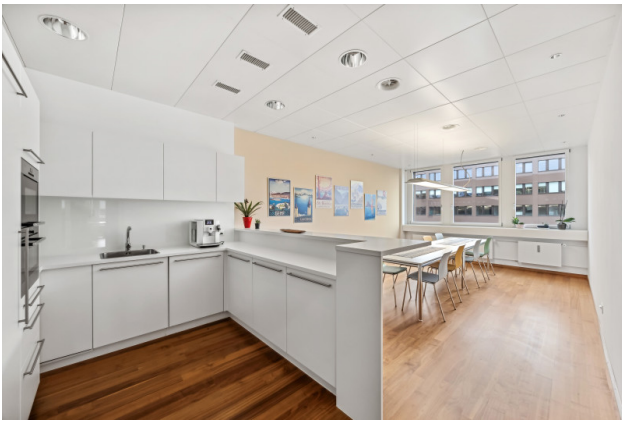
Küche / Aufenthaltsraum