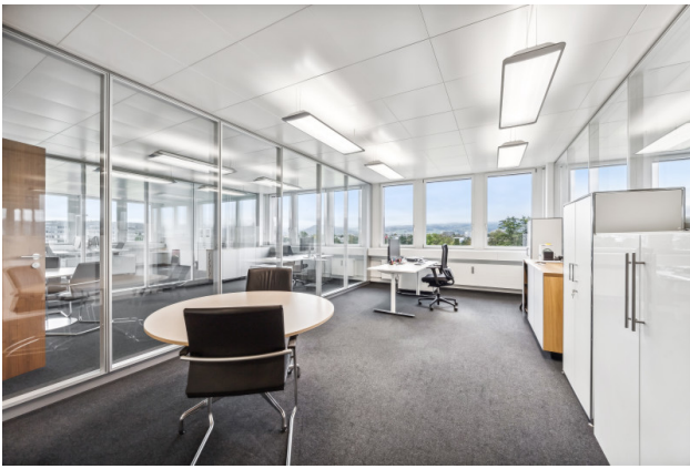
Einzelbüro Nr. 2