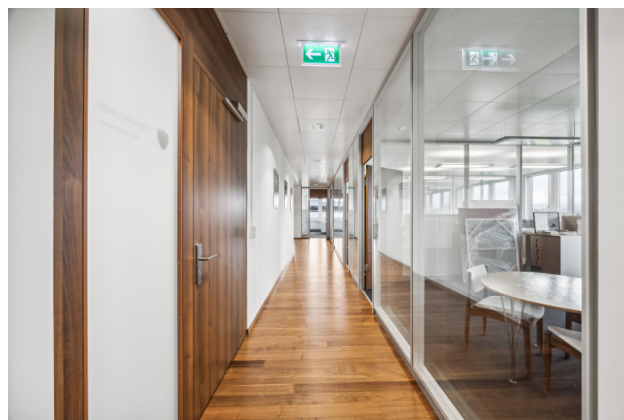
Bürofläche / Durchgang