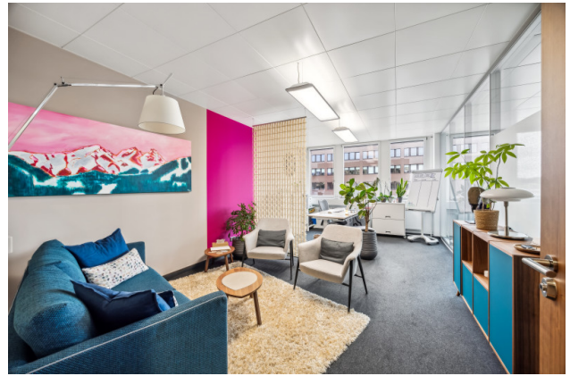
Einzelbüro Nr. 6