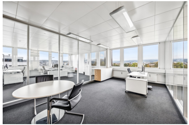
Einzelbüro Nr. 3