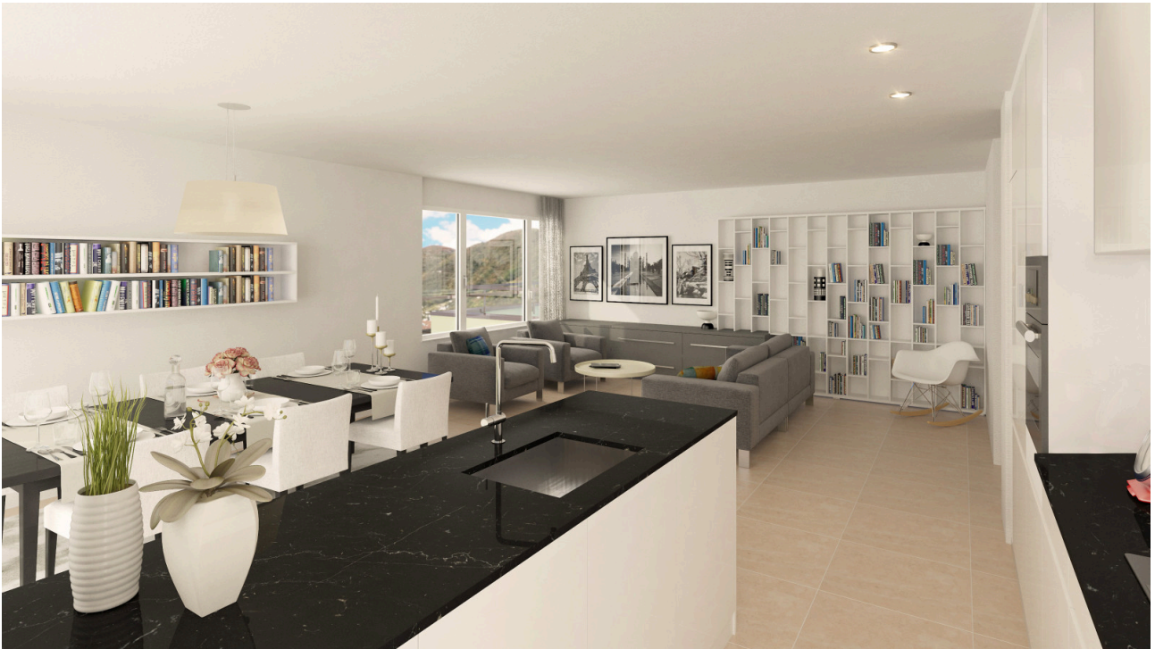
Foto indicativa a campione soggiorno cucina