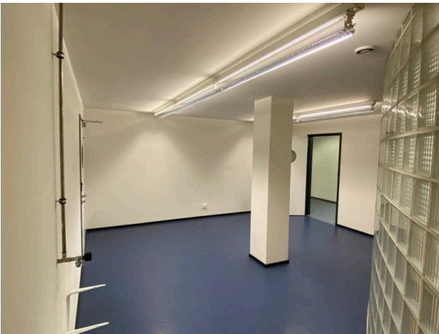
Raum mit Wasseranschluss