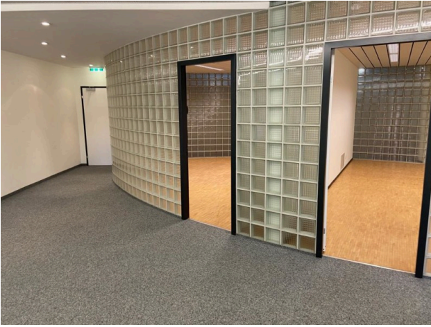
Räume für Sitzungszimmer