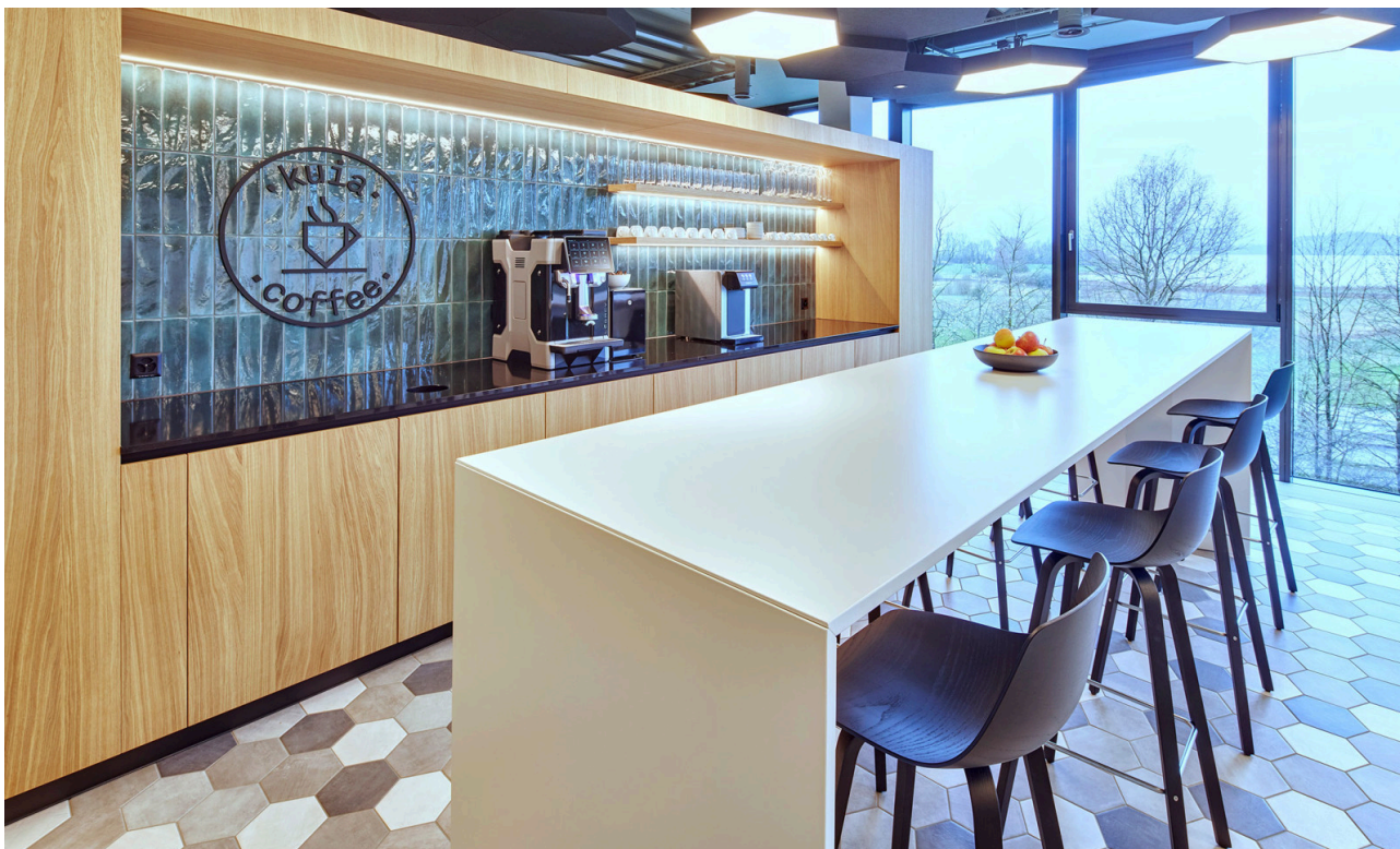
Der Coffee Corner ist der Treffpunkt im .kuia.office.