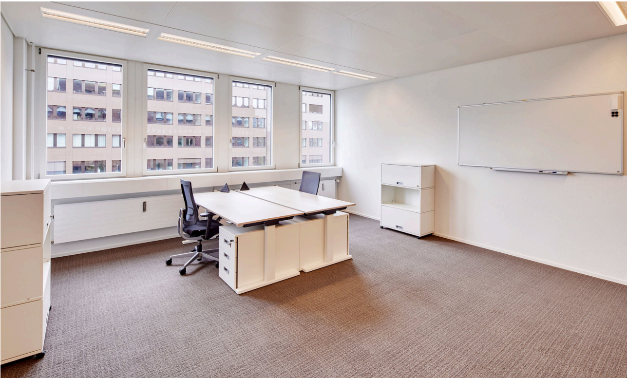
Teamoffice mit 2 bis 4 Arbeitsplätzen