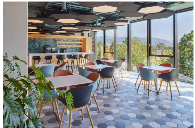
Treffpunkt für Austausch & Entspannung mit Weitblick