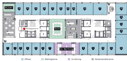
Übersichtsplan - 26 Offices / 2 Meetingräume / 12 Co-Working Arbeitsplätze / ästhetische Gemeinschaftsräume