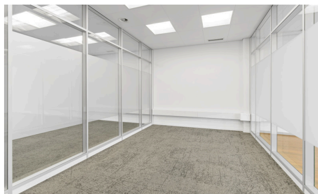
Tageslicht in allen Räumen