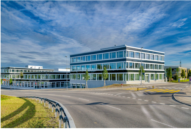
Vom Dorfzentrum Buchrain kommend mit Einfahrt Stegmattstrasse (Gebäude 1 im Vordergrund)