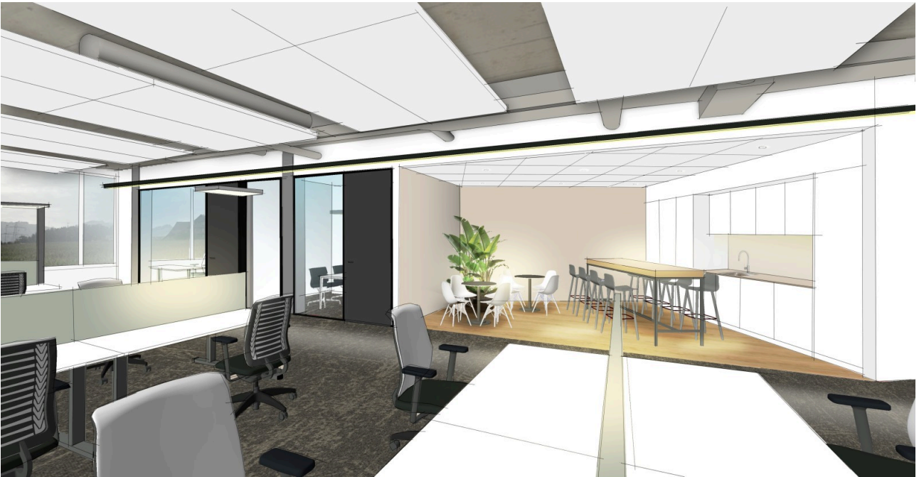
Visualisierung Büro 1.4.2 (identische Materialisierung im Büro 1.4.1)