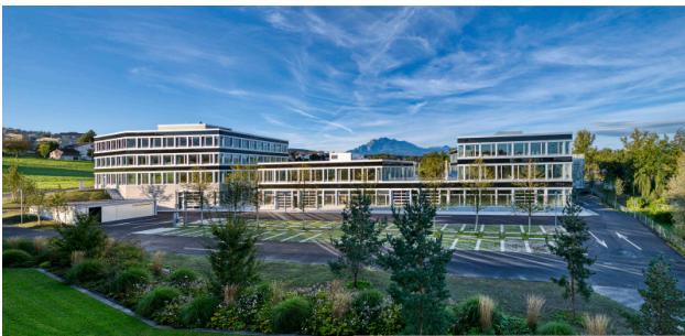
Rückseite der Gebäude 1, 3, 5 mit Pilatusblick