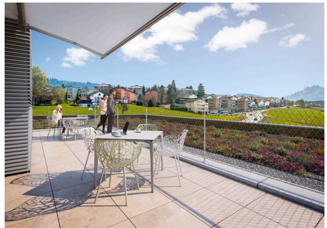
Dachterrasse zur Mitbenützung mit besten Aussichten