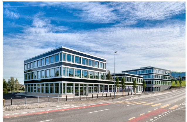
Kreuzung Dorf-, Hauptstrasse in Richtung Dorfzentrum Buchrain