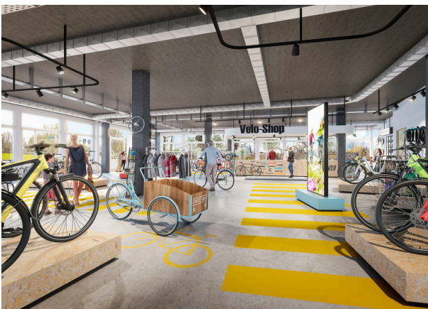
Ruhiges Gewerbe, Ausstellung, Labor, Praxis? Individueller Käuferausbau machts möglich!