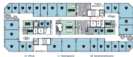
Übersichtsplan - 31 Offices / 6 Meetingräume / ästhetische Gemeinschaftsräume