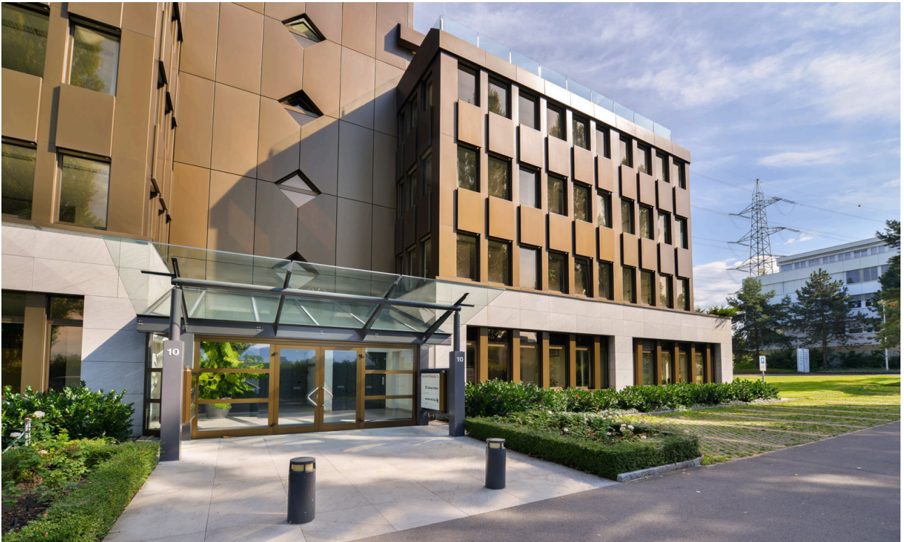
Hauptgebäudeeingang Süd – Neuhofstrasse 10: Willkommen an einem zentralen Standort