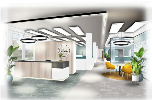
Visualisierungsvorschlag des Eingangsbereichs - modern und einladend