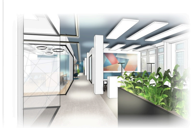
Visualisierungsvorschlag - Inspirierende Arbeitsplätze mit angrenzendem Sitzungszimmer