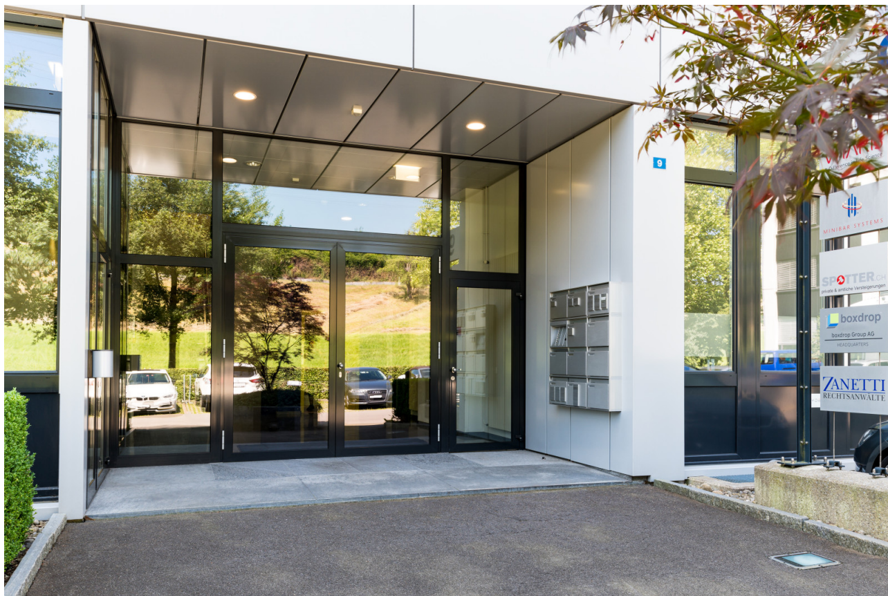
Haupteingang Blegistrasse 9