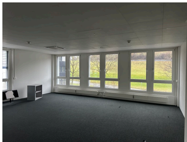
Innenansicht Einzelbüro Nr. 1