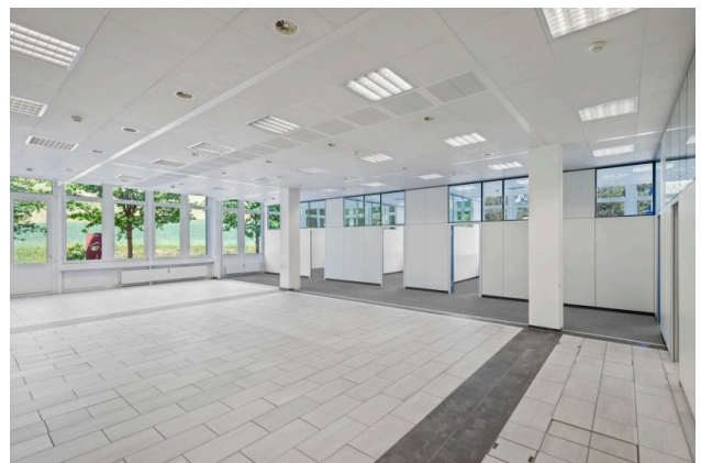
Offener Bürobereich mit Blick ins Grüne (Visualisierung Teppichboden)