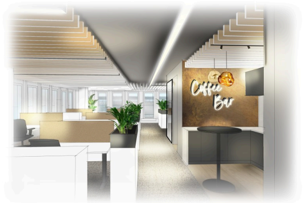
Visualisierungsvorschlag - Inspirierende Arbeitsplätze mit integrierter Coffee Bar