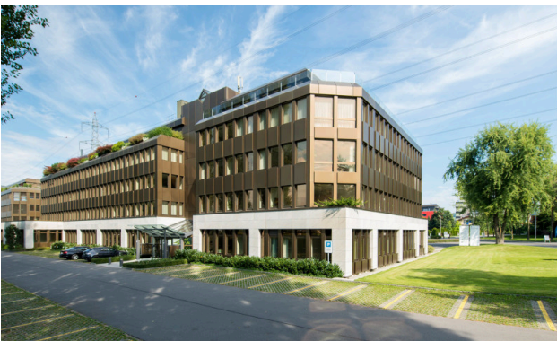
Südansicht des Geschäftshauses Neuhof – mit markanter, bronzener Metallfassade