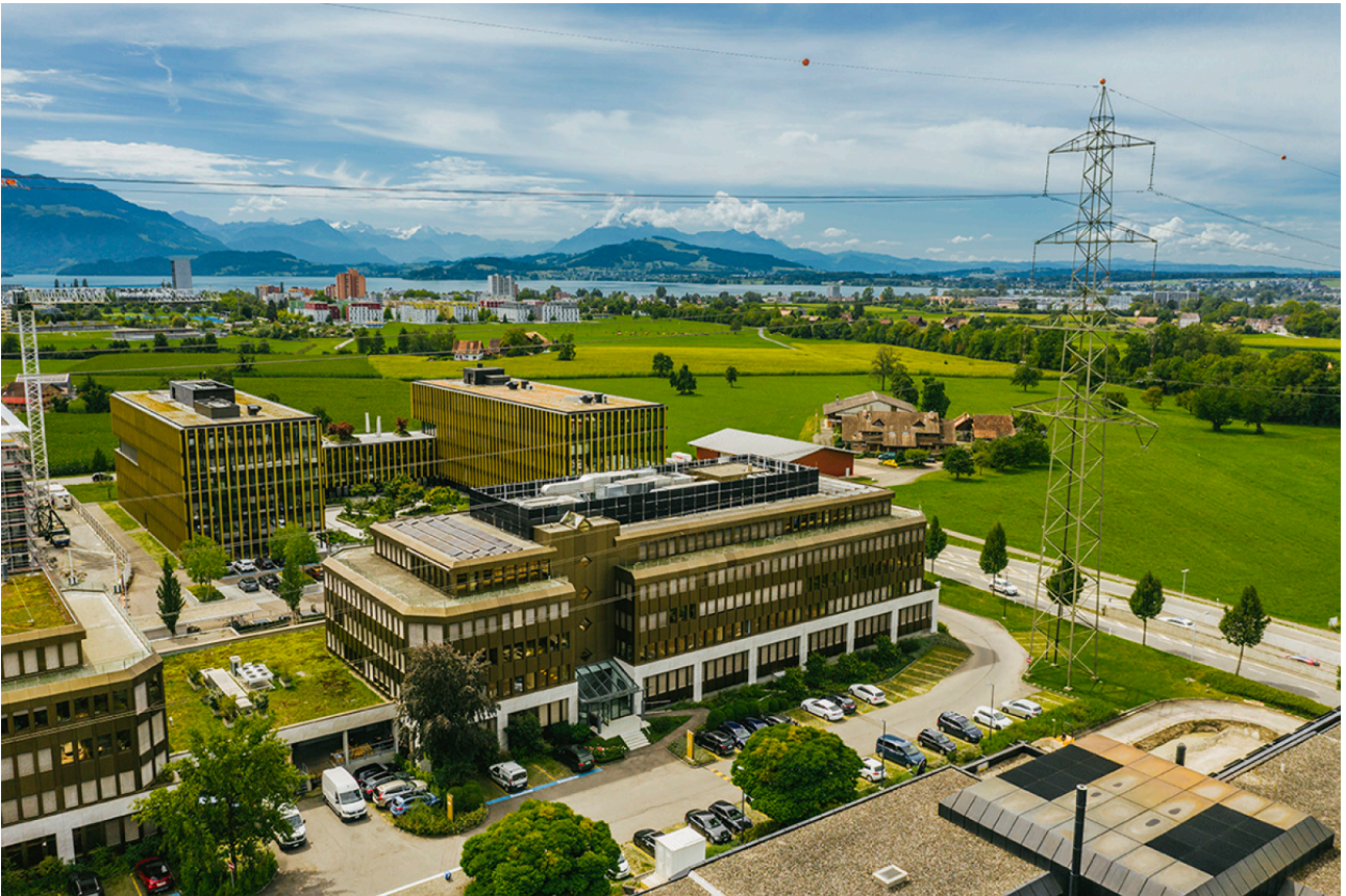
Blick von oben: Neuhof-Gebäude und die idyllische Natur rund um den Zugersee