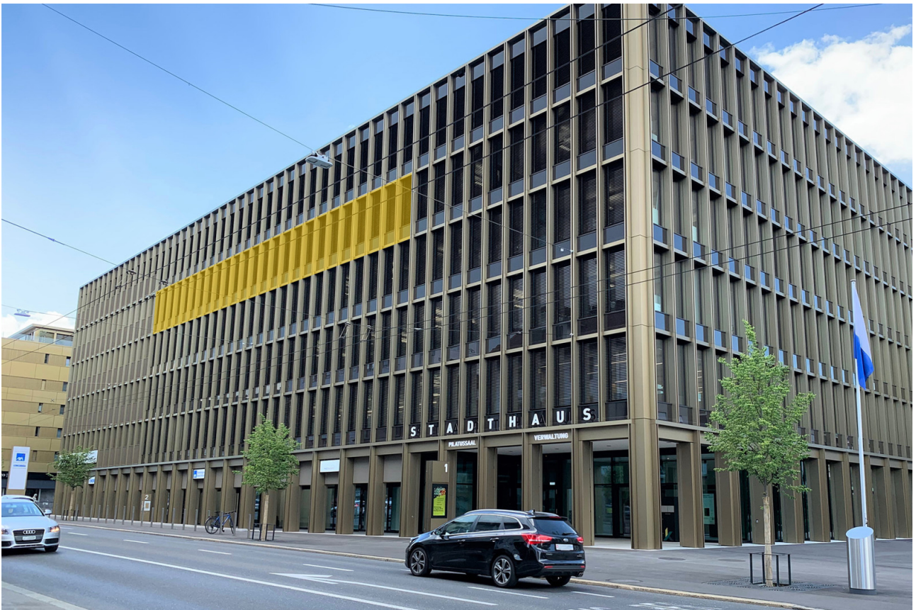
Südfassade mit Luzernerstrasse (Lage Mietfläche eingefärbt)