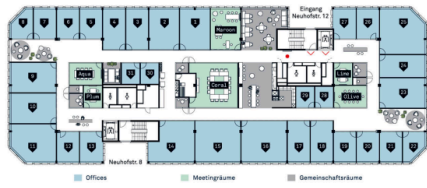
Übersichtsplan - 31 Offices / 6 Meetingräume / ästhetische Gemeinschaftsräume