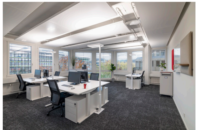
Ihr neues Eckbüro mit Aussicht - Office Nr. 11 mit Kapazität bis zu 7 Arbeitsplätzen