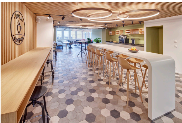
Der Coffee Corner ist der Treffpunkt im .kuia.office.