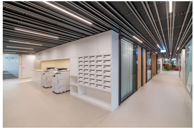
Der tägliche Postservice, die Druckgeräte (fair use) und wöchentliche Office-Reinigung sind im Preis inbegriffen.