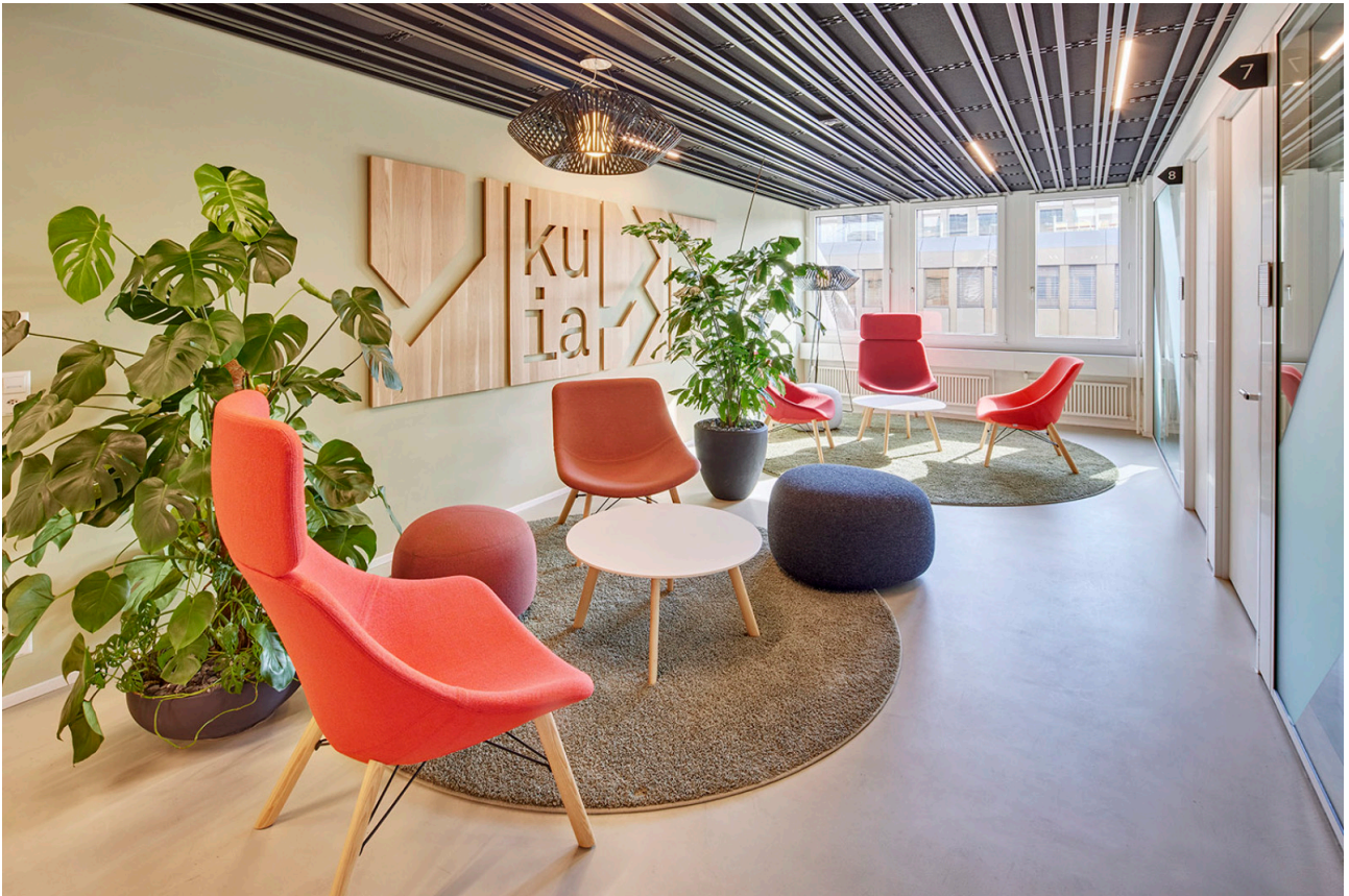
Die komfortablen Lounges laden zu einer kurzen Pause oder einem informellen Austausch ein.