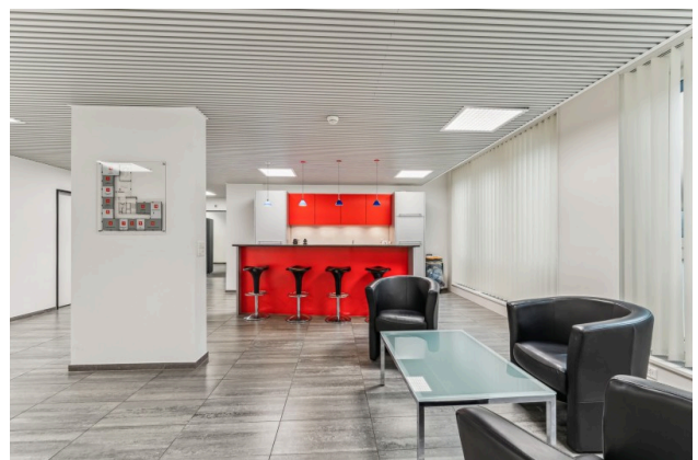
Cafébar zur gemeinsamen Benützung